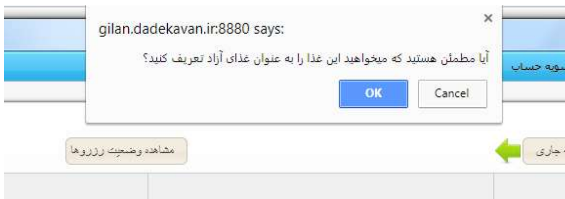
تصویر شماره ۲

سید آبی رنگی را در کنار غذای رزرو شده ی خود خواهد دید که با کلیک کردن بر آن از دانشجو سوال پرسیده می شود که آیا اطمینان دارد که غذای رزرو شده ی خود را به صورت آزاد برای خرید دیگران اعلام کند. (تصویر شماره ۲)